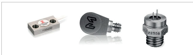
Рис.7. Варианты акселерометров компании Meggitt для измерения параметров удара среднего и высокого уровней

обеспечивающим стойкость к ударам и устранение эффекта неповторяемости нулевого сигнала до и после приложения ударного воздействия (рис.7).