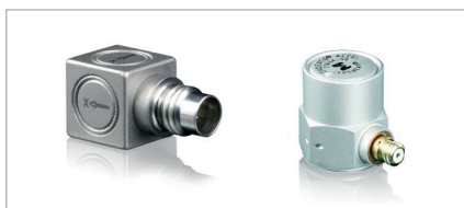
Рис.4. Трехосный (слева) и одноосный (справа) варианты исполнения акселерометров компании Meggitt