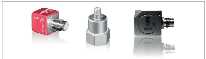
Рис.6. Пьезоэлектрические акселерометры со встроенной электроникой Isotron компании Meggitt (справа – высокотемпературный вариант)

Для приложений, не предусматривающих измерение высоких частот, подойдут емкостные акселерометры. Их полоса пропускания обычно варьируется в пределах от нескольких Гц до 1\text{ кГц} в зависимости от требуемой чувствительности. Например,