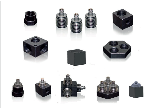
Рис.5. Линейка акселерометров 46AXX компании Meggitt

например, акселерометры Isotron производства компании Meggitt (рис.6). Они не требуют внешних усилителей заряда и могут быть использованы с обычными недорогими кабелями. Такие акселерометры работают от источника постоянного напряжения, которыми оборудованы, например, системы сбора данных. Если известен диапазон измеряемых частот и требуемый температурный диапазон находится в пределах от -55 до 125^{\circ}\text{C} , то следует остановить свой выбор на акселерометрах со встроенной электроникой. Стоит отметить, что для высокотемпературного варианта исполнения максимальная рабочая температура достигает 175^{\circ}\text{C} .