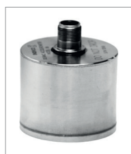
Рис. 8. Акселерометр компании Meggitt для измерения низкочастотных колебаний

Сведения о магнитной восприимчивости в настоящее время указываются редко, так как с применением современных материалов проблема утратила актуальность.