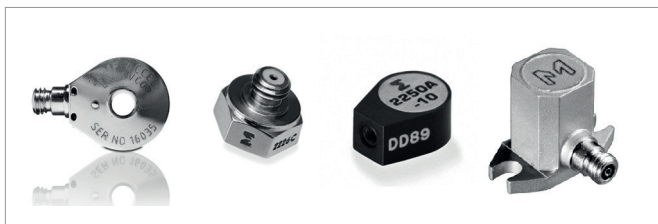
Рис.1. Варианты пьезоэлектрических акселерометров компании Meggitt

идеально подходят для измерения низкочастотных колебаний, постоянных ускорений и параметров движения объектов.